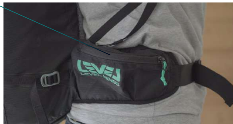
Mode petite poche